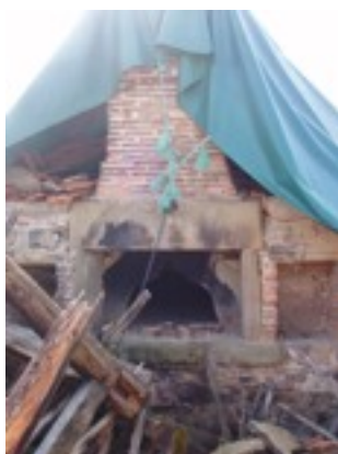
Gueule du four