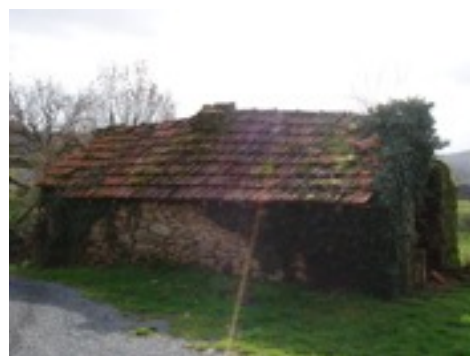
Vue du four depuis la route