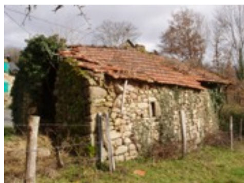
Vue du four depuis les prés