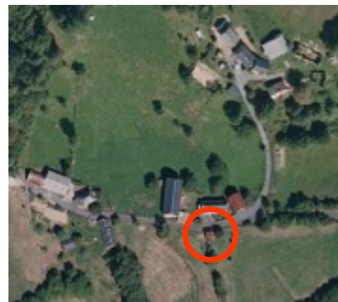
Localisation aérienne IGN