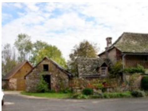
Vue du four depuis la placette