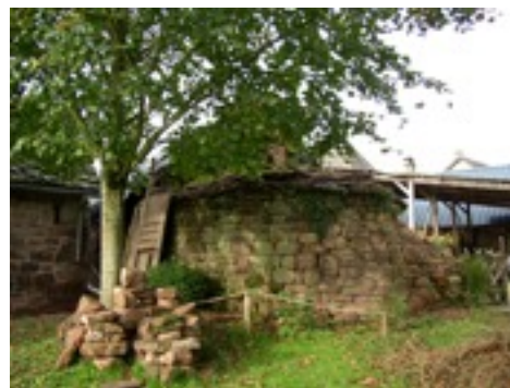
Vue du cul de four