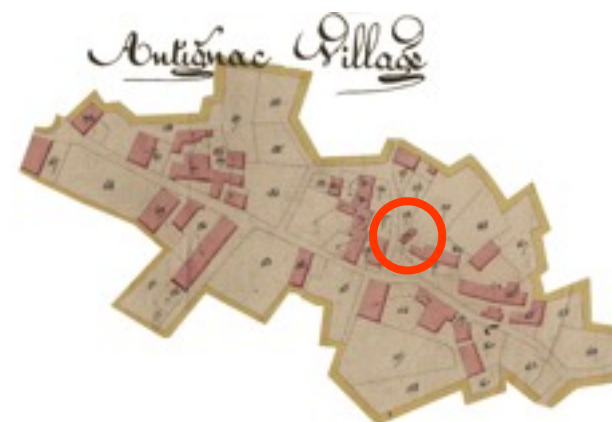
Cadastré napoléonien, 1831 AD de la Corrèze