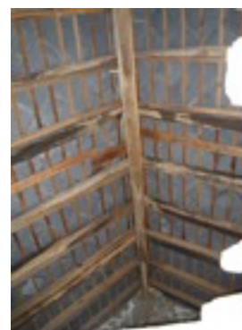
Vue intérieure: charpente