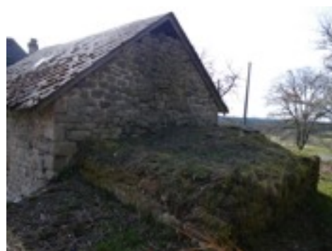
Arrière du four