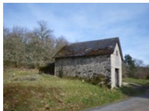
Vue d'ensemble du four et de ses abords