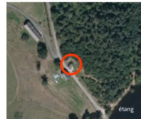
Situation sur vue aérienne IGN