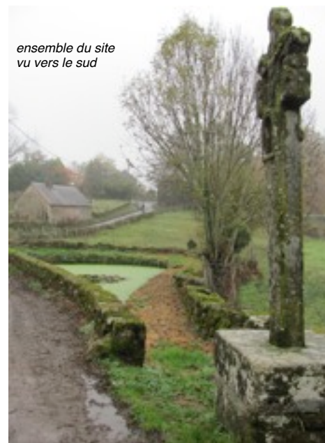
ensemble du site vu vers le sud