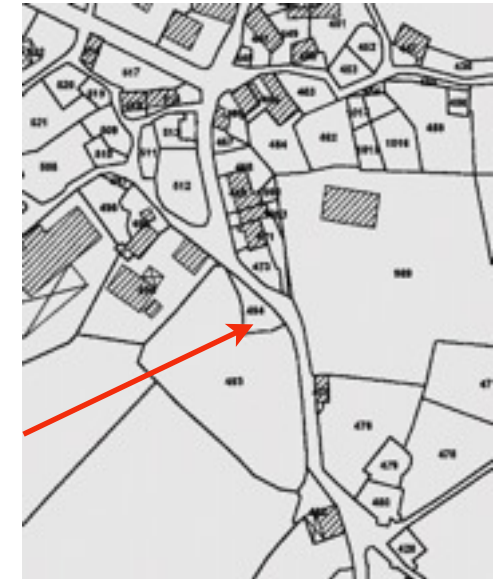
cadastre actuel et vue aérienne IGN