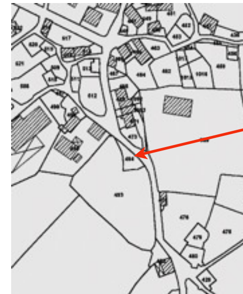
cadastre actuel et vue aérienne