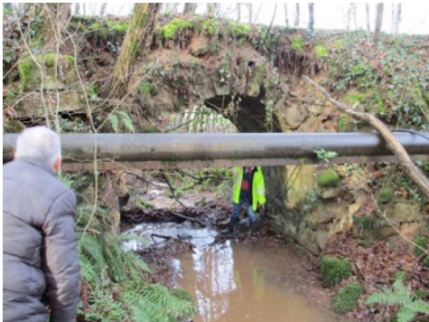
le pont côté amont

Suite à des ravinements et effondrements partiels, la municipalité souhaite restaurer ou reconstruire ce pont car il est très fréquenté par les promeneurs [GR 46 à 400m, centre équestre proche, nombreux VTT etc.] et il est devenu dangereux.