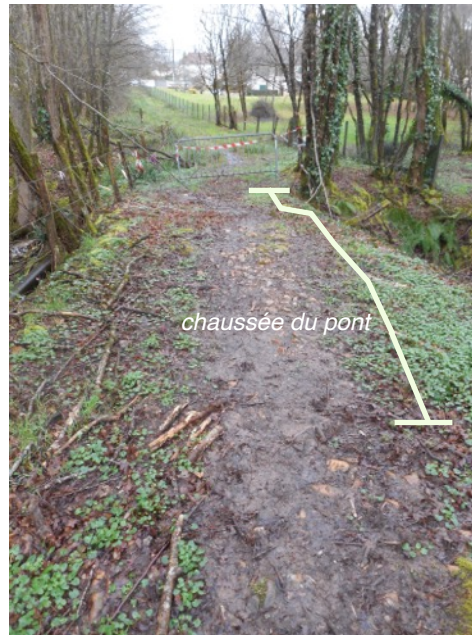
le chemin, vue vers l'ouest