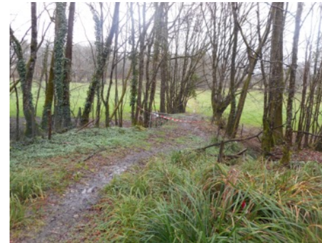
le site, vue vers l'est