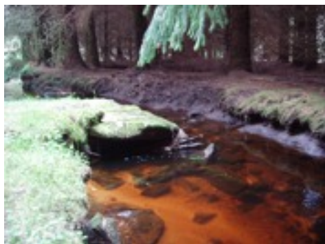
vue du site (le bief)

Un chemin de randonnée traverse le site.