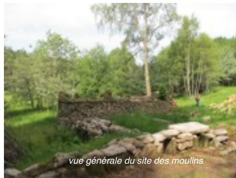
vue générale du site des moulins

L'association «la pierre levée» a entrepris depuis plusieurs années une action de revitalisation des moulins (restaurations et animations) et d'autres petits patrimoines. C'est dans ce contexte que la commune souhaite porter la mise en valeur du site des moulins du village du Rat. Sa particularité vient de la juxtaposition de deux moulins : le premier, commun, à moudre le grain, le second, rare en haute Corrèze, à huile. A noter à proximité le site exceptionnel de la chapelle du Rat (IMH).