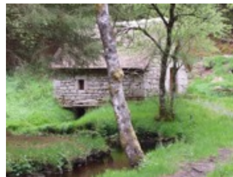
vue du moulin restauré