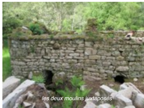
les deux moulins juxtaposés