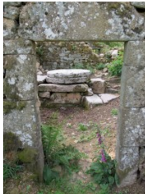
entrée et intérieur du moulin