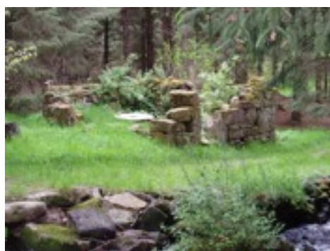
vue du moulin ruiné