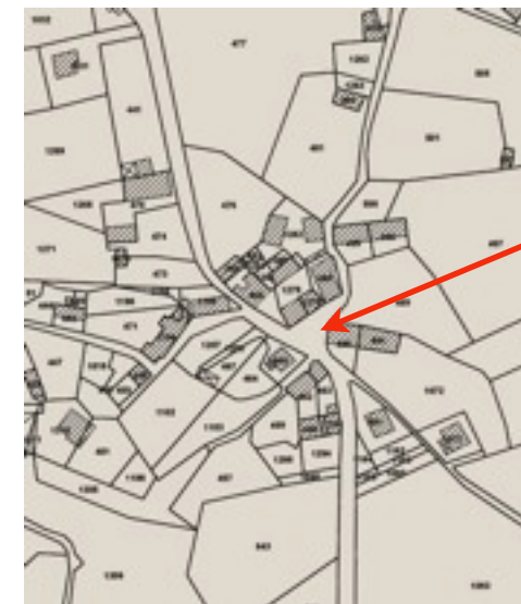
Situation sur le plan cadastral actuel et en vue aérienne (Fond IGN)