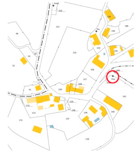
cadastre actuel et vue aérienne