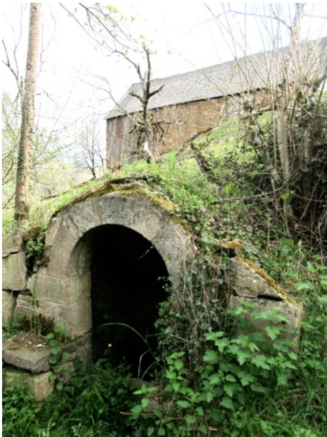
intérieur de la fontaine