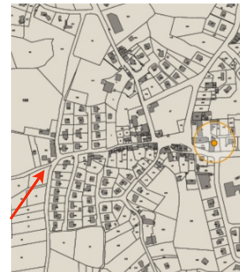
Situation sur le plan cadastral actuel et en vue aérienne