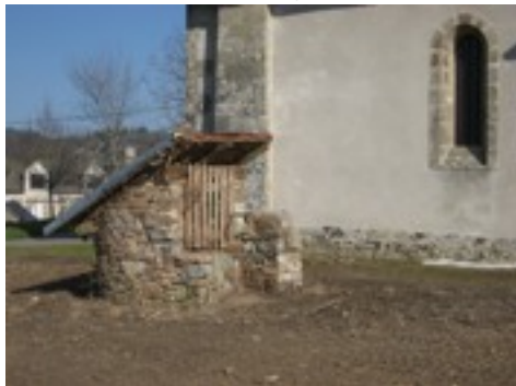
vues d'ensemble : le puits et l'église à l'arrière.

Longtemps envahi par le lierre, il a été récemment dégagé et apparaît dans un état correct, seule la toiture étant à reprendre. Conservée celle-ci pourra être restaurée à l'identique sans erreur.