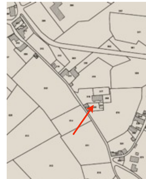
Situation sur le plan cadastral actuel et en vue aérienne (Fond IGN)