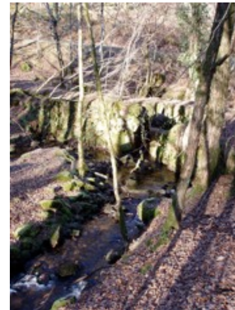
vue du pont depuis l'aval