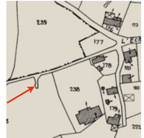
Situation sur le plan cadastral actuel et en vue aérienne (Fond IGN)