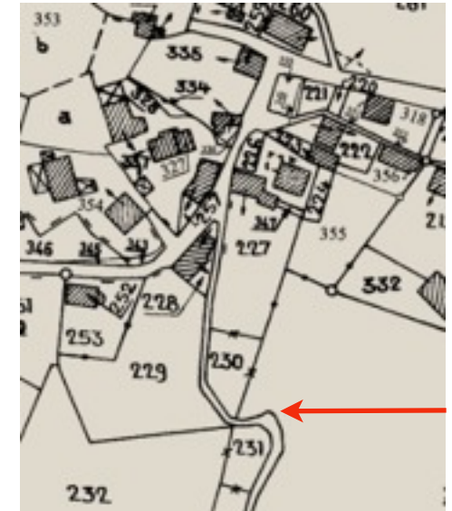
Situation sur le plan cadastral actuel et en vue aérienne (Fond IGN)