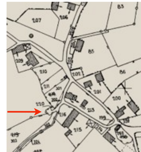
Situation sur le plan cadastral actuel et en vue aérienne (Fond IGN)