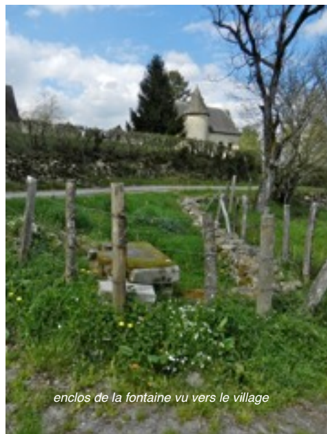
enclos de la fontaine vu vers le village