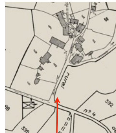
Situation sur le plan cadastral actuel et en vue aérienne