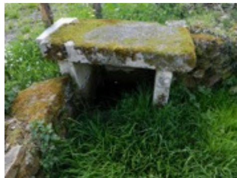
Ouverture de la fontaine