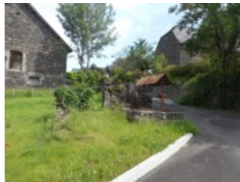
vue de profil du puits

Vue d'ensemble depuis la sortie du parking