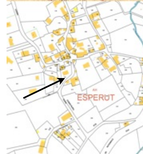
Extrait cadastres napoléonien et actuel