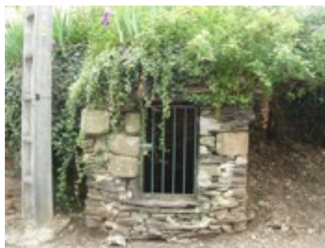
Puits vu de face