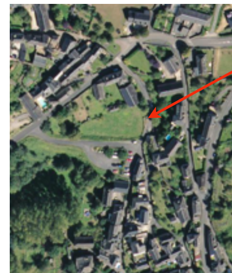
Situation sur le plan cadastral actuel et en vue aérienne