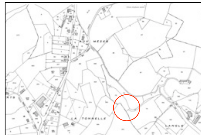
situation des pêcheries sur le plan cadastral