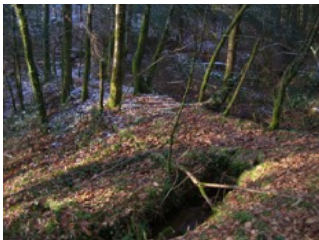
arrivée sur site ; vue de la pêcherie haute, sa digue, et le départ du canal au premier plan.

On perçoit un effet de cuvette, néanmoins la retenue ressemble à un simple barrage en terre. La superficie du bassin est inférieure à celle de la pêcherie haute.